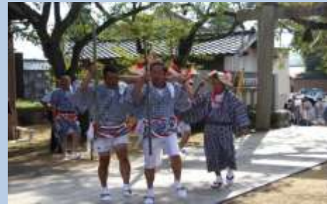
境内での「七五三吊り」