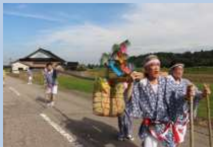
「道中吊り」で進む「吊り物」

9月17日、秋晴れの空の下、末友では獅子舞用具の新調を記念した「吊り物」が行われました。七振りの吊物が沿道からの声援を受けて威勢よく進み、末友八幡宮境内では、「七五三吊り」という、行ったり来たり歩みに盛大な拍手が送られました。勇壮な獅子舞が披露された後、奉納された餅が撒かれ、大勢の観客で賑わいました。